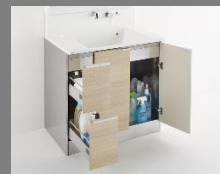
引出しタイプ(スタンダードレール)

小分けができる引出しと、収納スペースの広い開き扉の組み合わせで、効率よく収納できます。